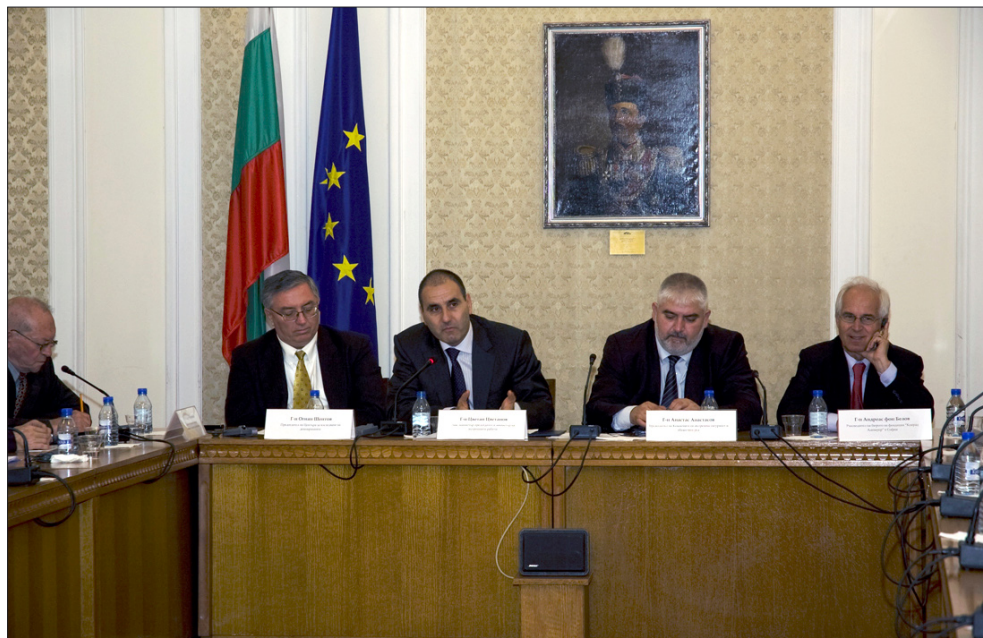
Публична дискусия на тема „Динамика на конвенционалната престъпност в България 2009 – 2010 г.“. Отляво надясно: д-р Огнян Шентов, Председател на Центъра за изследване на демокрацията, Цветан Цветанов, Зам.-министър председател и Министър на вътрешните работи, Анастас Анастасов, Председател на Комисията по вътрешна сигурност и обществен ред на 41-то НС, Андреас фон Белов, Ръководител на бюрото на Фондация „Конрад Аденауер“ в София.

дискусия на тема „Динамика на конвенционалната престъпност в България 2009 – 2010 г.“. Пред участниците в дискусията бяха представени основните изводи от Националното изследване на престъпността 2010 г. (НИП 2010) и резултатите от работата на МВР по противодействие на престъпността през 2009 г.