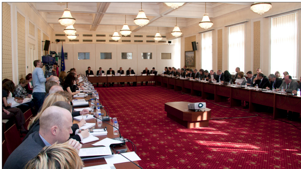
Участниците в кръглата маса на тема „Корупция без граници: връзката между корупцията и организираната престъпност в Европейския съюз”, 16 ноември 2010 г.

През април 2010 г. по инициатива на Европейската комисия, изследването беше представено пред представители на министерствата на вътрешните работи на 27-те страни-членки на ЕС, през юни на заседание на Комисията по граждански свободи, правосъдие и вътрешни работи (LIBE) на Европейския парламент, а на 16 ноември 2010 г. и пред българската общественост по времето на кръгла маса на тема „Корупция без граници: връзката между корупцията и организираната престъпност в Европейския съюз”. Пред участниците в кръглата маса бяха представени резултатите и изводите от първото системно изследване на връзките и взаимодействието между организираната престъпност и корупцията като инструмент за действие в 27-те страни-членки на ЕС, както и препоръки към Европейската комисия и отделните държави-членки за практически мерки и политики в тази област.