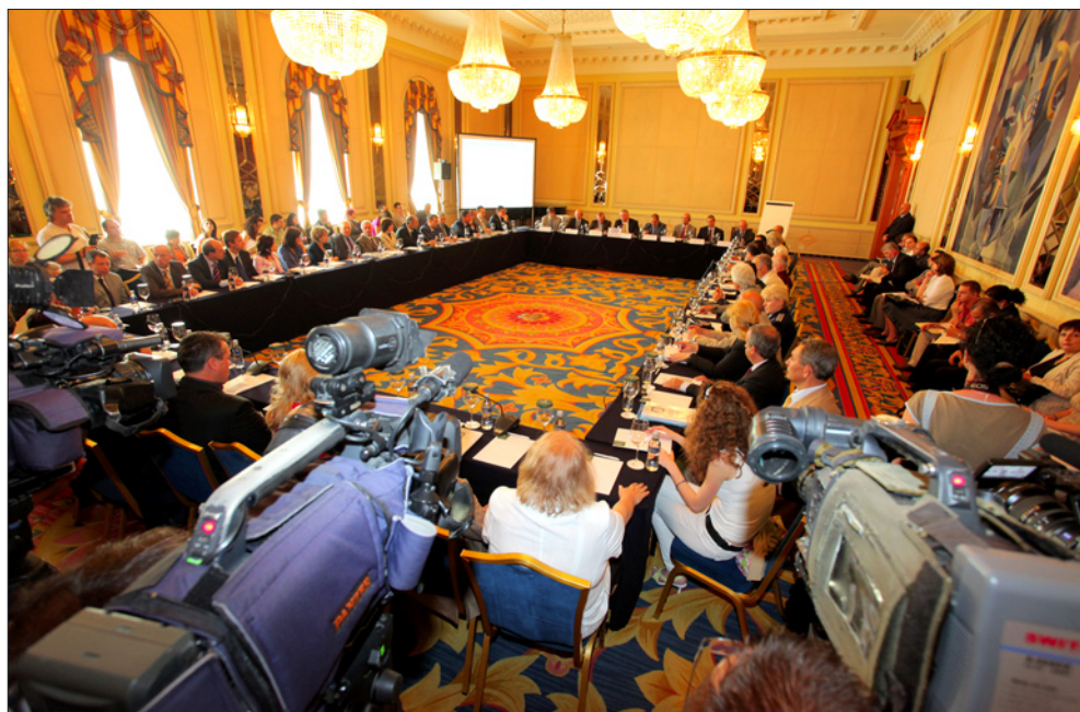
Участниците в кръглата маса „Оценка на риска от организирана престъпност“, 18 юни 2010 г.