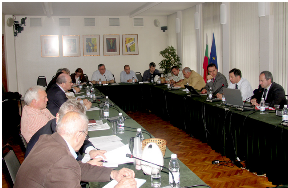
Обсъждане на проекта за Стратегия за национална сигурност на Република България, 30 юни 2010 г.

ду двете гранични институции бяха идентифицирани въз основа на информацията, събрана с електронни анкети сред полицейски и митнически служители в 26 страни-членки (без Люксембург), 230 интервюта и 25 посещения на място в 12 от страните. В допълнение към анализа на правните и оперативните аспекти на сътрудничеството, в България бяха изследвани и основните институционални, политически и културни аспекти в работата на граничните органи.