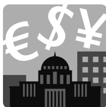
Правителствени политики (71 критерия)