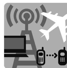
Инфраструктура (114 критерия)