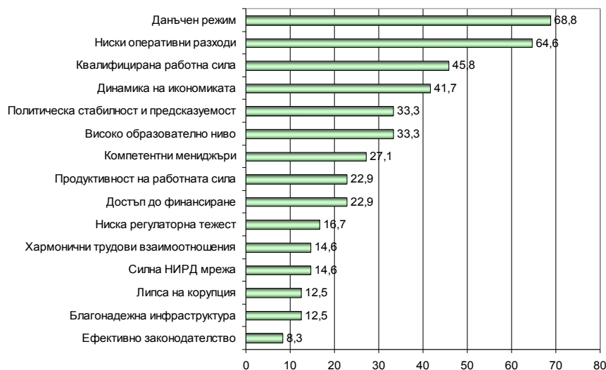
Графика 3: Основни показатели за привлекателността на българската икономика