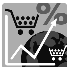
Икономически резултати (78 критерия)

(Общо 331 критерия, от които 132 статистически/твърди данни, 116 от изследване сред бизнеса и 83 допълнителни индикатора с информативна цел, които не са включени в представените рангове)