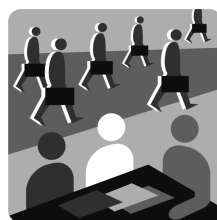
Бизнес среда (68 критерия)