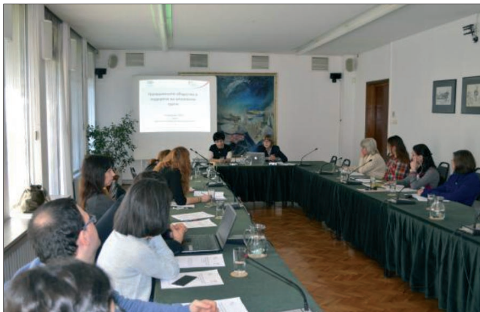
Работна среща „Гражданското общество в подкрепа на уязвимите групи“

за равни права пред държавата на четири уязвими групи – чужденци, търсещи международна закрила, лишени от свобода, жертви на трафик на хора и на домашно насилие. Резултатите от изследванията и предложените практически мерки бяха широко разгласени чрез специалната секция на интернет страницата на Центъра, както и в социалните мрежи.