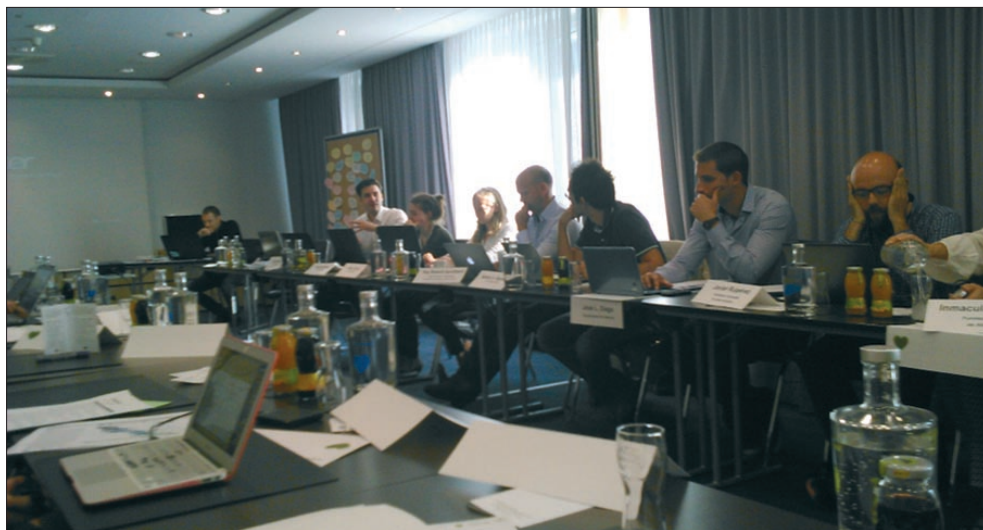
По време на срещата на инициативата TAKEDOWN във Виена

По време на първата среща на инициативата на 12-14 септември 2016 г. във Виена, Австрия, представители на всички участващи организации обсъ-