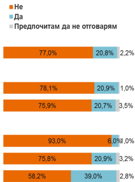
Графика 3: Някога през последната година, срещал ли си се на живо с някого, с когото първо си се запознал в интернет?

Една трета от българските деца са общували онлайн с човек, когото не са срещали на живо. Тук няма разлика между момичетата и момчетата, но пък има значително увеличение с възрастта. Най-притеснителното е, че около една пета от тези деца са се срещали на живо с хора, с които първо са се запознали в интернет. В сравнение с 2010 г. значително повече тийнейджъри са готови да предприемат подобна стъпка, като може да се каже, че за децата над 15-годишна възраст запознанството с хора онлайн се е превърнало в норма.