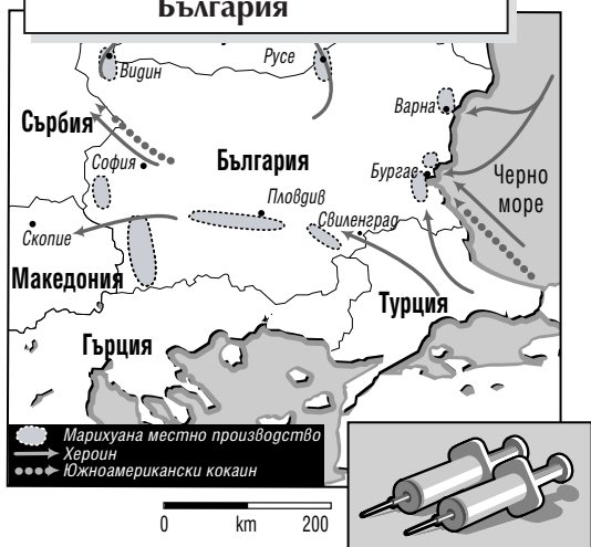
Схема 8: Трафик на наркотици и производството им в България

В Румъния трафикът на наркотици е в постоянен възход, въпреки усилията на правозащитните органи. Новата администрация прокара по-строги закони, преследващи трафика на наркотици и тяхното производство. Въведени бяха санкции от 15 години до доживотен затвор за притежание, дистрибуция и производство на наркотици. Предприетите сериозни мерки от полицията доведоха до увеличаващ се брой арести на пласъори и до конфискация на наркотици, въпреки бюджетните ограничения, остарялата и недостатъчна екипировка и ширещата се корупция. През 2001 г. бяха разкрити 3 тайни лаборатории за производство на синтетични наркотици, което потвърди опасенията, че Румъния се е превърнала във важна производителка на дрога. 97