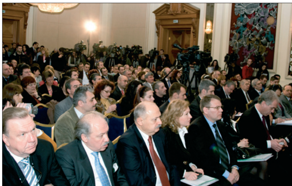
Участниците в Петия национален иновационен форум

По време на форума се състоя церемонията по награждаване на отличените предприятия в конкурса „Иновативно предприятие на годината“. Наградите на победителите бяха връчени от Президента на Република България г-н Георги Първанов. Целта на конкурса е да покаже добрия български модел за бизнес, да привлече вниманието на широката общественост върху постиженията на българските предприятия в областта на иновациите. В конкурса могат да участват иноватив-