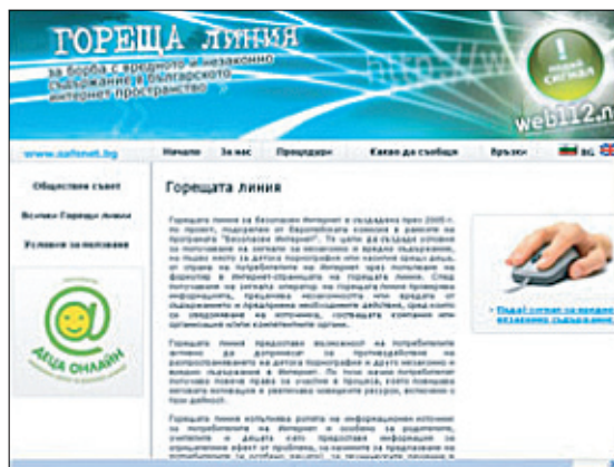
Новият дизайн на Горещата линия

Обновеният сайт на Горещата линия за борба с незаконно и вредно за деца съдържание и поведение в интернет улеснява посетителите в подаването на сигнали благодарение на опростената процедура и насочваща помощна информация.