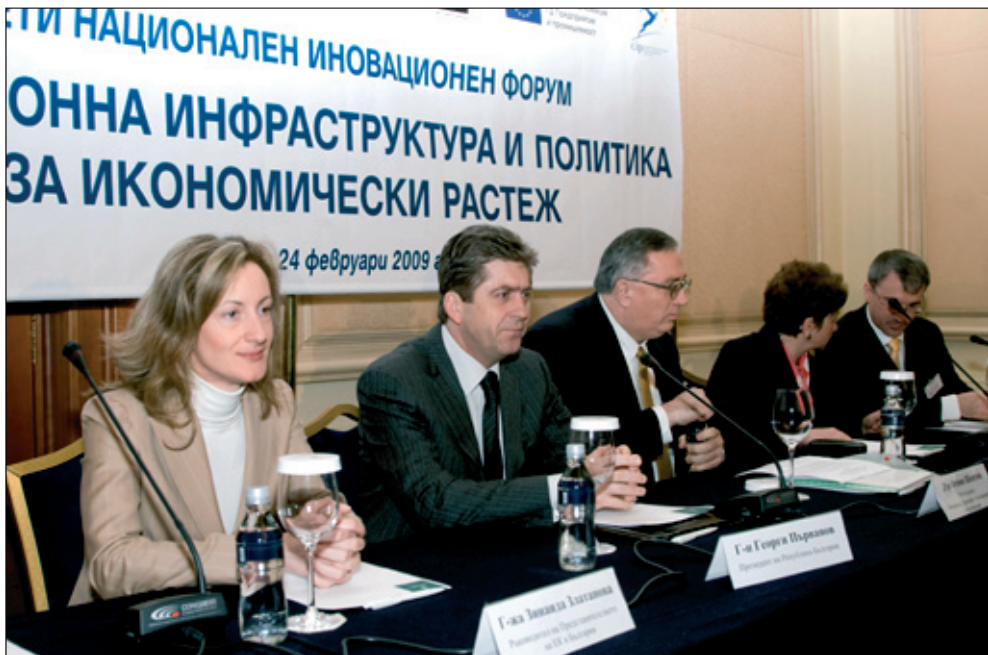
Откриване на Петия национален иновационен форум, 24 февруари 2009 г. От ляво надясно: г-жа Зинаида Златанова, Ръководител на Представителството на Европейската комисия в България; г-н Георги Първанов, Президент на Р България; г-р Огнян Шентов, Председател на УС на фондация ПИК; г-жа Меглена Плулчиева, Заместник-председател на Министерския съвет на Р България; г-н Флорин Фихтъл, Представител на Световната банка в България.

Участници във форума са ръководители от публичния и частния сектор, народни представители, неправителствени организации, бизнес асоциации, фирми, консултанти, посредници и финансиращи организации, медии, Европейската комисия (ГД „Предприятия“ и ГД „Научни изследвания“), академични и развойни организации, Световна банка, Европейска банка за възстановяване и развитие, водещи международни експерти в областта на иновациите, представители на многонационални компании.