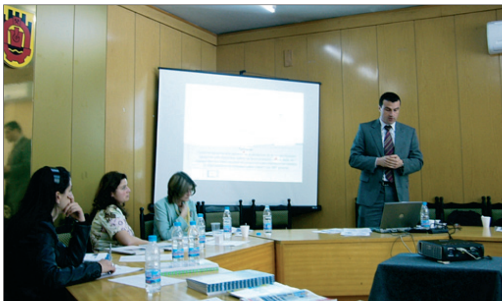
Представяне на европейски програми за финансиране на бизнеса в Областна администрация Перник