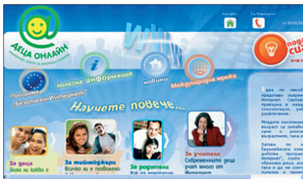
Порталът на Центъра за безопасен интернет

отношение към осигуряването на безопасна онлайн среда за деца и подрастващи. Към Обществения съвет през годината се присъединиха трите мобилни оператора Мобилтел, ГЛОБУЛ и Виваком, както и Майкрософт България.