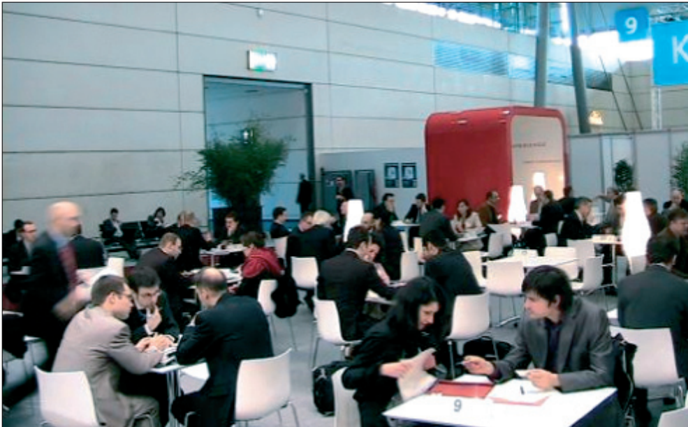
Двустранни бизнес срещи по време на Международния панаир CeBit, Хановър, Германия