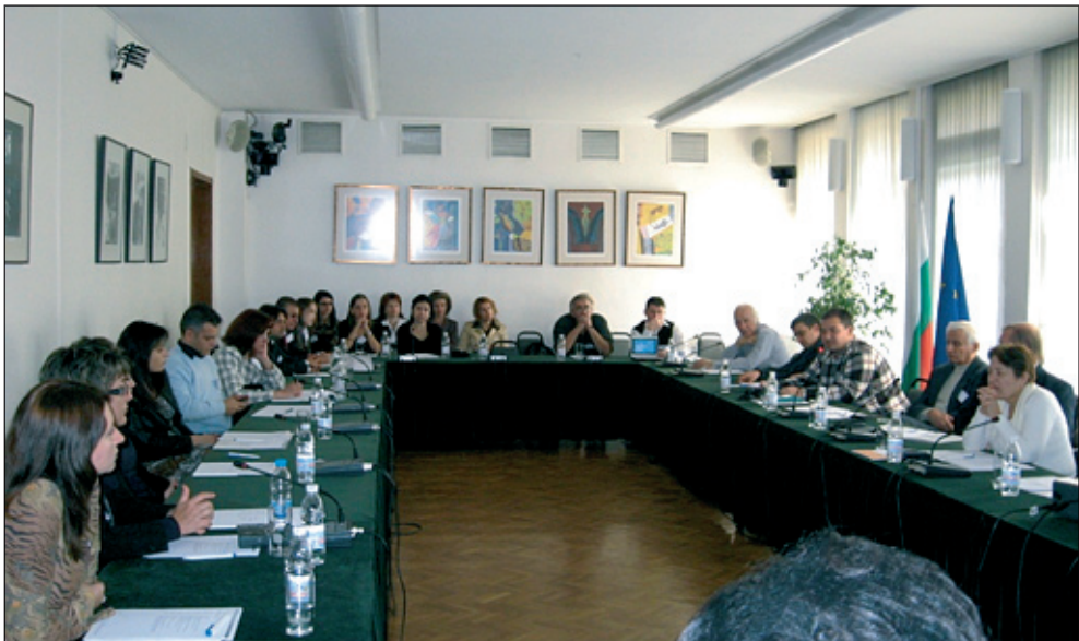
Съвместен семинар на Enterprise Europe Network-България и Патентно ведомство на Р. България

идея, продукт, услуга или процес, Мрежата консултира в областта на интелектуалната собственост и патентите. Enterprise Europe Network помага да се определи максималния потенциален ефект от идеите на организациите. Тя може да улесни връзката със съответните организации и адвокати, като пести време и пари. Мрежата работи в тясно сътрудничество със специализирани организации (като Патентно ведомство на Република България, IPR Helpdesk на Европейската комисия), които помагат на малкия бизнес да защити интелектуалната собственост за своите идеи и иновации, за да му донесат те печалба. През 2009 г. Патентното ведомство на Р. България в сътрудничество с Фондация ПИК и Enterprise Europe Network – България организираха семинар на тема „Как да не бъдем нарушители и как да се защитим