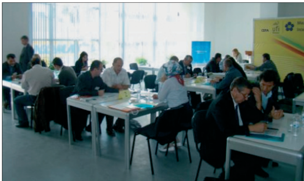
Двустранни бизнес срещи по време на Есенния технически панаир в Пловдив