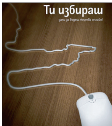
Плакатът на кампанията „Ти избираш“

Идеята за кампанията „Ти избираш“ дойде от двама български ученика, която бяха направили собствен клип, предупреждаващ за опасностите в интернет. Клипът беше преснет професионално с участието на децата и беше даден старт на кампанията.