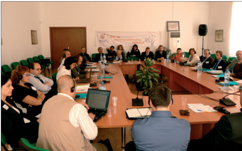
Технически университет – Габрово: дискусия за академичното предприемачество, опита на академичните инкубатори и проблемите на връзката наука-бизнес

През последните две десетилетия в повечето от страните в Източна Европа и Централна Азия се извърши преход от планирана към пазарна икономика. Стимулирането на предприемачеството и иновациите чрез свързване на науката, бизнеса и правителството се превърна в основно предизвикателство за повишаване конкурентоспособността на икономиките в региона и за стабилно пазарно-ориентирано развитие. Бизнес инкубаторите, технологичните паркове и офисите за технологичен трансфер играят ключова роля в процеса на комерсиализация на науката и са от основно значение за развитието на национални и регионални иновационни кълъстери.