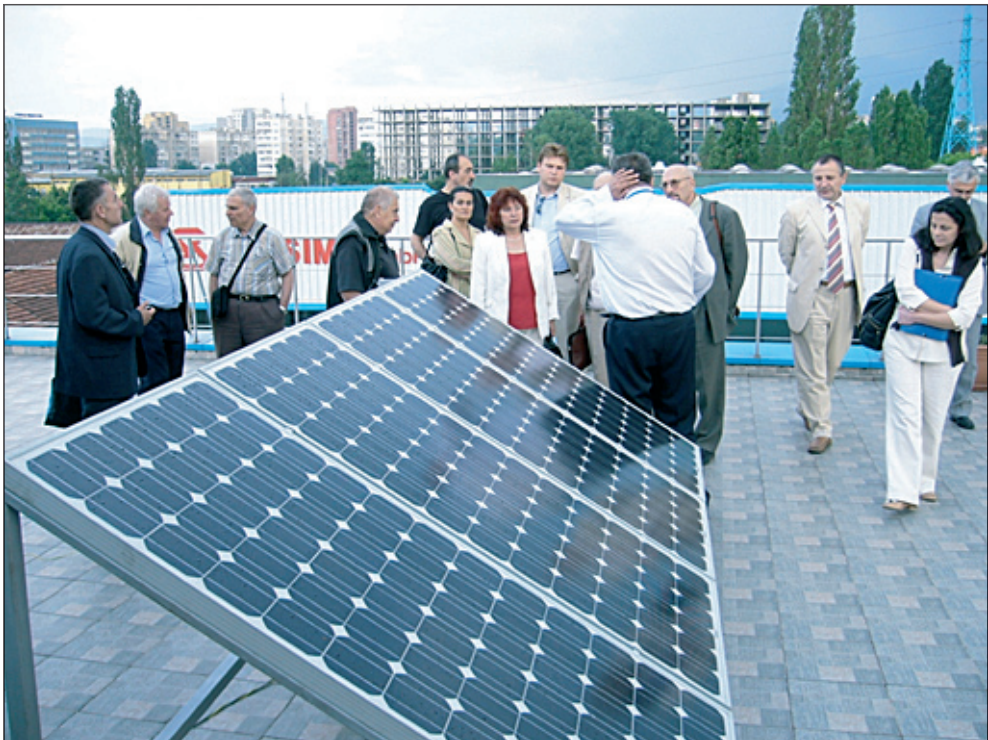
Среща на Бизнес клуба по иновации във фирма „Спесима” ООД