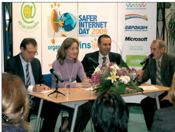
Откриване на втората кампания „Деца безопасно в Интернет“

На 4 февруари в представителството на Европейския съюз в София беше организирана среща, на която пред медиите бяха представени инициативите за отбелязване на Деня за безопасен интернет. Трите мобилни оператора Мобилтел, Глобул и Вивател обявиха първата по рода си SMS-кампания, в рамките на която на 10 февруари бяха изпратени близо 3 милиона съобщения до техните абонати.