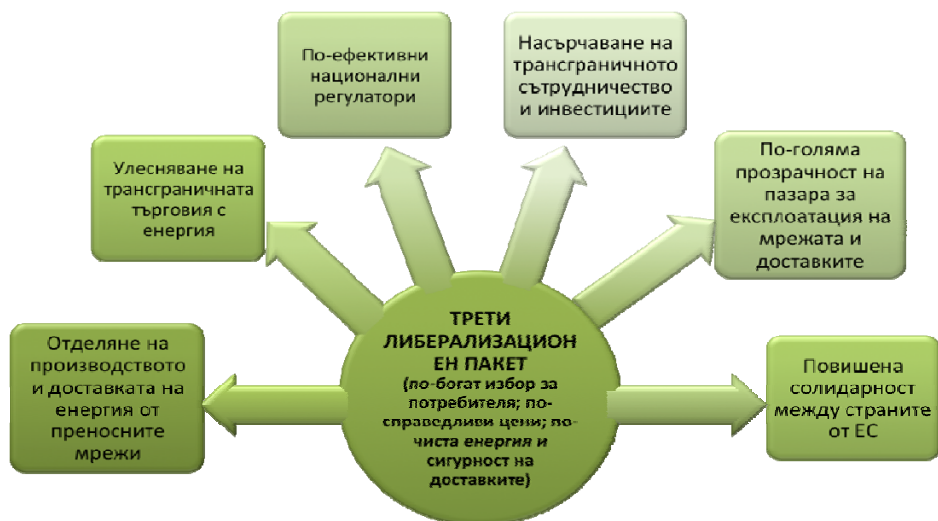
Фигура 2: Трети либерализационен пакет на ЕС