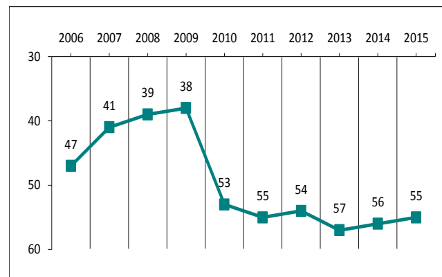
Фигура 1. Класиране на България в Годишника на световната конкурентоспособност