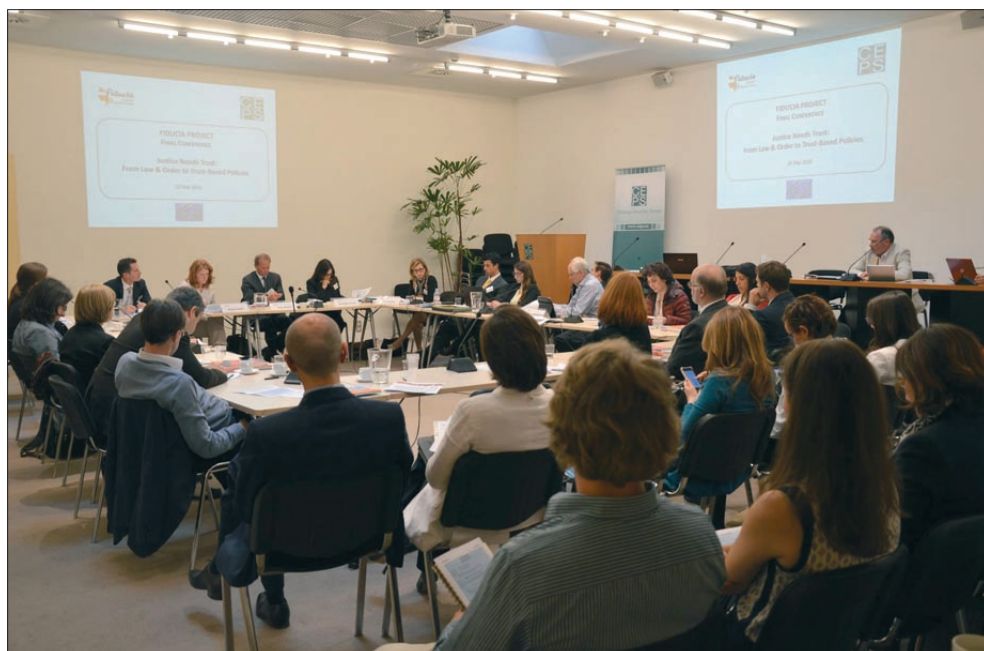
Конференция „Правосъдието се нуждае от доверие: от закон и ред до политики, основани на доверие“, Брюксел

По покана на Университета в Саламанка – един от партньорите по инициативата FIDUCIA, на 16 май 2015 г.