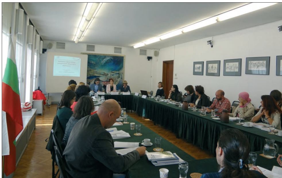
Кръгла маса „Уязвимите групи между гражданското общество и държавата“, София

мери от успешното сътрудничество на Комисията с НПО. В първия панел на кръглата маса авторският екип на доклада „Подкрепа на уязвимите групи пред държавата: ролята на гражданските организации“ представи изследването във връзка с всяка една уязвима група и получи коментари от присъстващите ангажирани институции. Във втория панел на кръглата маса г-жа Миряна Илчева, научен