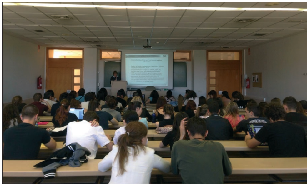
Семинар „Компютърните престъпления – национални и международни политики и отговорност на частния сектор“, Саламанка

Източник: Изследването на FIDUCIA, 2014 – 2015.