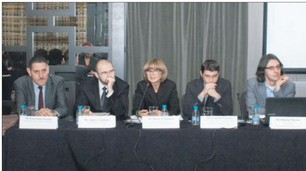
Международна конференция „Ресоциализация на осъдените в Европейския съюз: укрепване на ролята на гражданското общество“

Правната програма проучи и възможностите за подобряване на пенитенциарната система във връзка с една особено уязвима група лишени от свобода – употребяващите наркотици. По различни оценки, употребяващите и зависими от наркотици са около 10-15 % от лишените от свобода. Попаднали в затвора, и особено след освобождаването си, тези лица попадат във вакуум по отношение на адекватно третиране, което да предо-