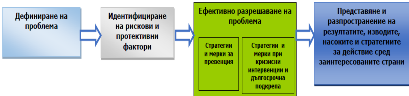
Схема на теоретичната рамка на Модела за подкрепа на жертви на насилие, основана върху подхода на общественото здраве