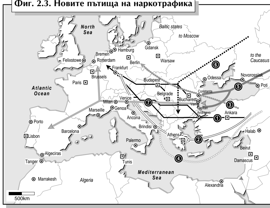
Фиг. 2.3. Новите пътища на наркотрафика