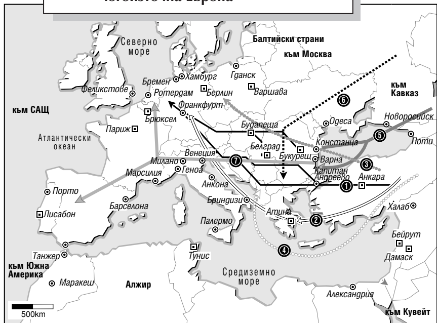
Фиг.6. Наркоканалите преминаващи през югоизточна Европа