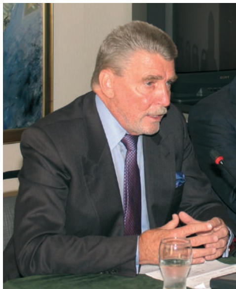
Г-н Браян Дженкинс, старши съветник на президента на „РАНД корпорейшън“