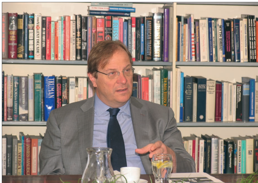
Г-н Фредерик Кемп, президент и главен изпълнителен директор на Атлантическия съвет на САЩ

ложение той запозна участниците с развитието на обстановката в Египет, възможните последици от гражданската война в Сирия и развитието на терористичната мрежа „Ал-Кайда“.