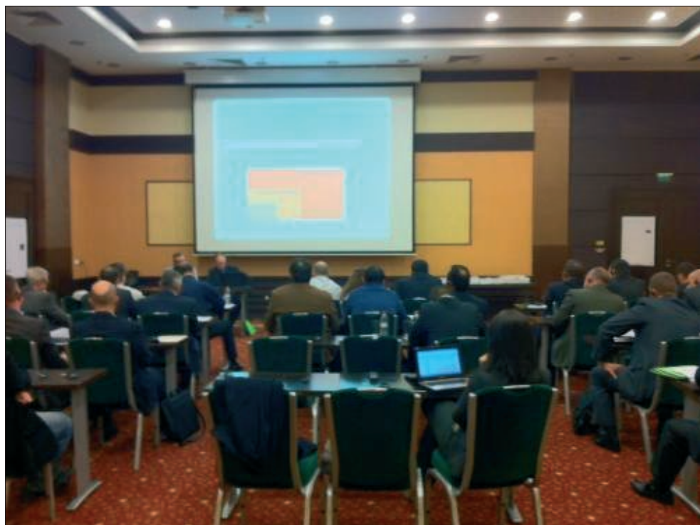
Участници в семинара „Европейският опит в противодействието на корупцията в полицията“

летия в повечето европейски страни се обръща все по-голямо внимание. За разлика от противодействието на корупцията в други професионални кръгове като тези на магистрати, политици или служители в данъчната администрация, за които липсват стандартни или общоевропейски подходи, при противодействието на корупцията в полицията нещата стоят по-различно. На национално равнище в редица европейски страни са разработени стратегии и в правоохранителните органи са предприети реформи, често под надзора на законодателните институции. На европейско равнище съществуват платформи като ЕПСК (Европейски партньори срещу корупцията), където институциите, отговорни за противодействието на корупцията си сътрудничат и