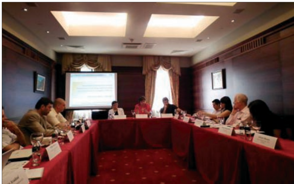
Участници в семинара „Участието на гражданското общество в антикорупционните политики: Българският опит“

ставители на органи на българската държавна администрация, които имат за задача превенция и борба с корупцията и да получат информация за целите им и за формите и методите им на работа за тяхното постигане. Едновременно с това представителите на българската държавна администрация запознаха участниците със своите практики на съвместна работа с неправителствения сектор и с вижданията си за ролята и мястото на гражданското общество в борбата с корупцията и перспективите за развитие на сътрудничеството в тази област.