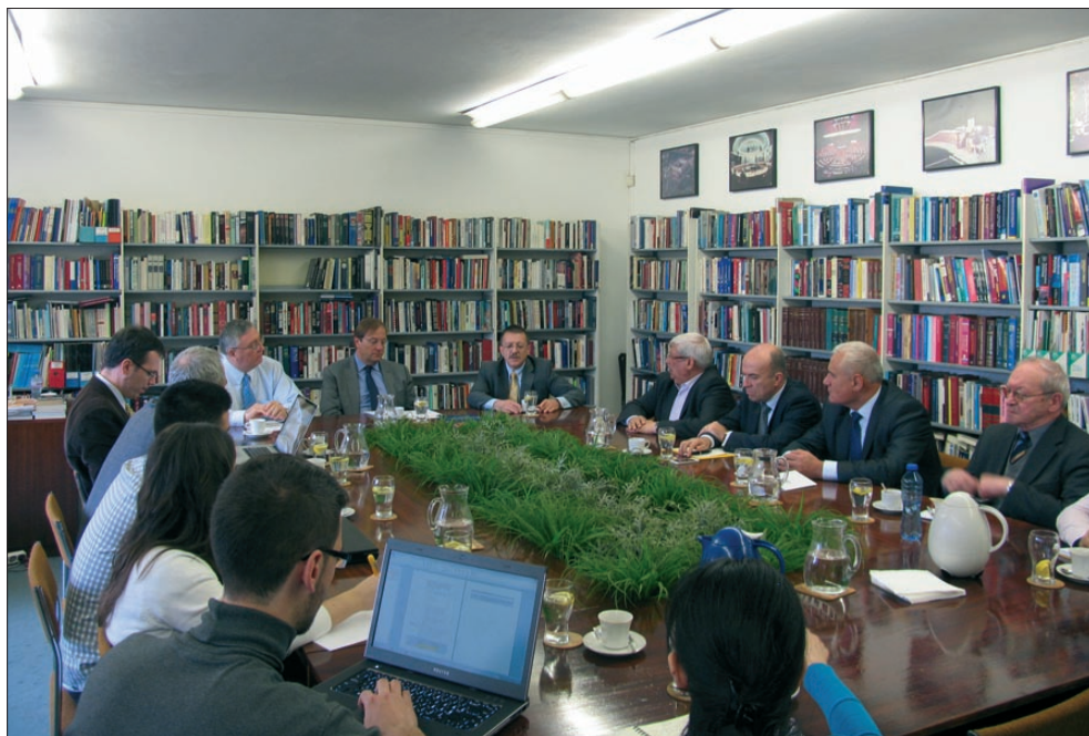
Участници в кръглата маса „Трансатлантическа солидарност в условия на криза“