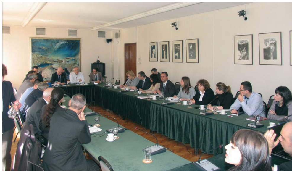
Участници в кръглата маса на тема „Финансиране на тероризма“

беше поставен и върху примерите за връзки между терористични организации и държавни разузнавателни служби. Коментирайки подчертано бюрократичната структура на този тип организации и тяхната вътрешна йерархия, д-р Рансторп подчерта и ролята на идеологията в определянето на дневния им ред.