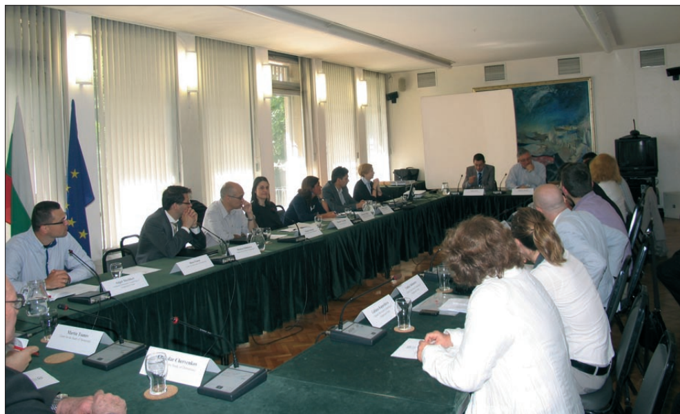
Участници в семинара „Финансиране на организираните престъпни дейности: Предизвикателствата на една неизследвана област“

В резултат на изследователската работа бе разработен Наръчник за разследването на финансирането на организи-