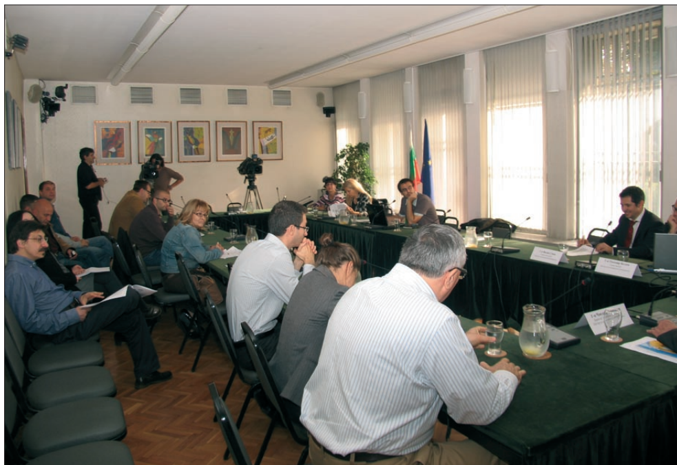
Публична дискусия „Динамика на конвенционалната престъпност 2012 – 2013“