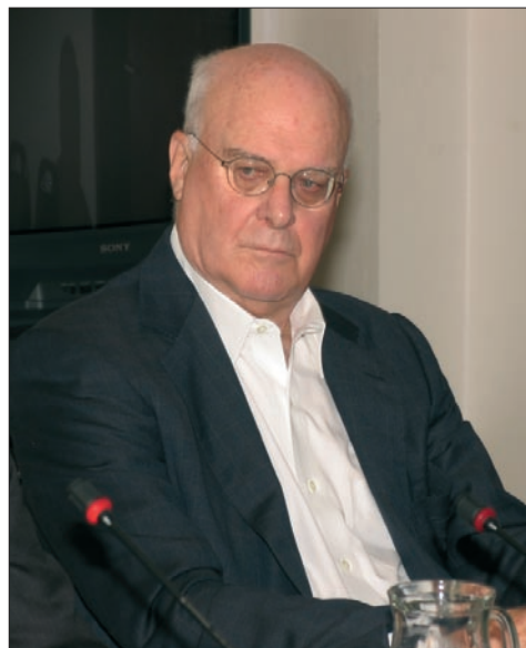
Посланик Робърт Гелбърд – бивши дипломатически представител на САЩ на Балканите