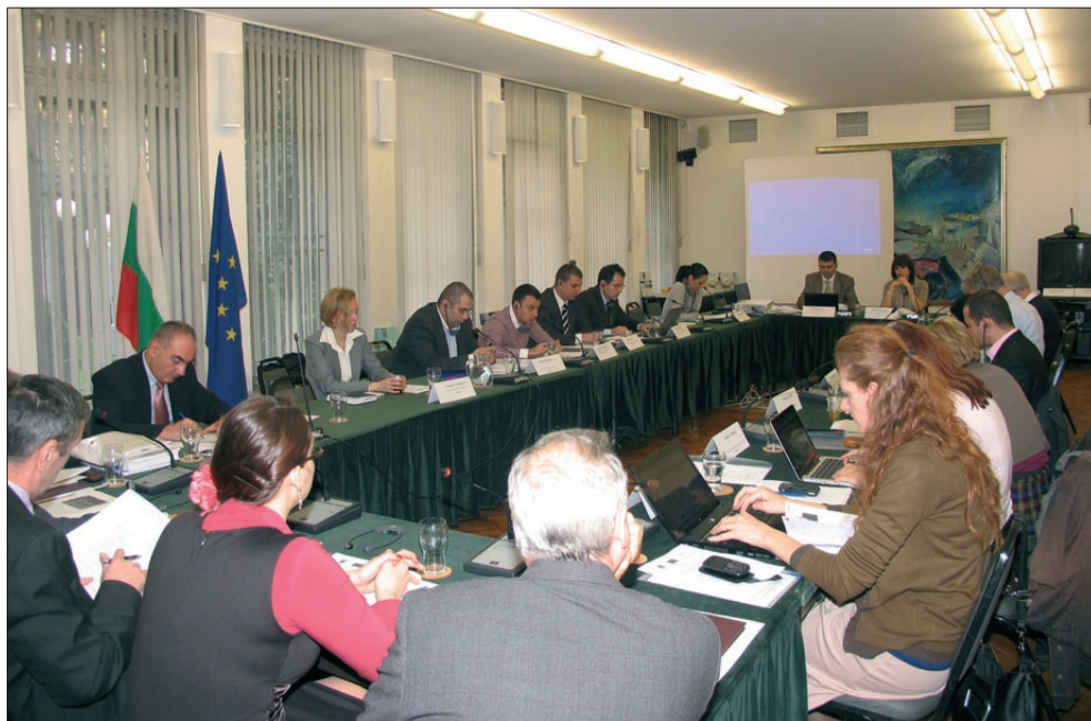
В периода 15-17 април 2013 г. Центърът за изследване на демокрацията организира семинар на тема: „Участието на гражданското общество в изготвянето, прилагането и оценката на антикорупционни политики“