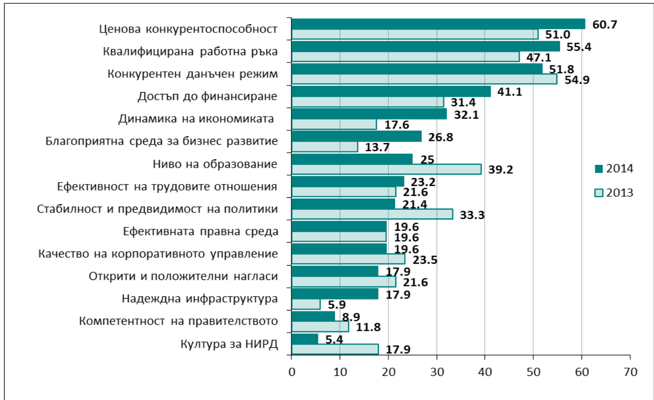
Фигура 3: Ключови индикатори за конкурентоспособността на България за 2014 г.