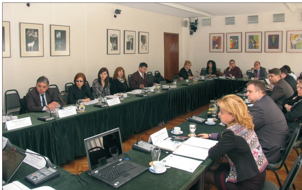
Обучение за положението на пострадалите от престъпления в наказателното производство и за достъпа им до правна помощ (20 март 2014 г.)

Националният доклад за България относно правната помощ на жертвите, изготвен от екипа на Правната програма, беше представен на 30 май 2014 г. по време на сесия на Националния съвет за подпомагане и компенсация на пострадали от престъпления, на който бяха обсъдени възможни бъдещи усилия. На 6 юни 2014 г. екипът на