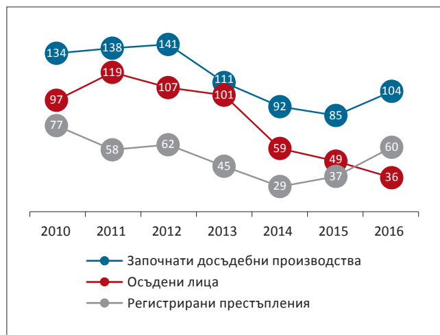
Фигура 2. Регистрирани престъпления, досъдебни производства и осъдени за трафик на хора, 2010 – 2016 г.