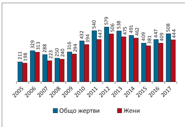
Фигура 1. Жертви на трафик, участвали в съдебни производства, 2005 – 2017 г.

Последните публични данни от няколко държави – членки на ЕС обаче разкриват, че броят на