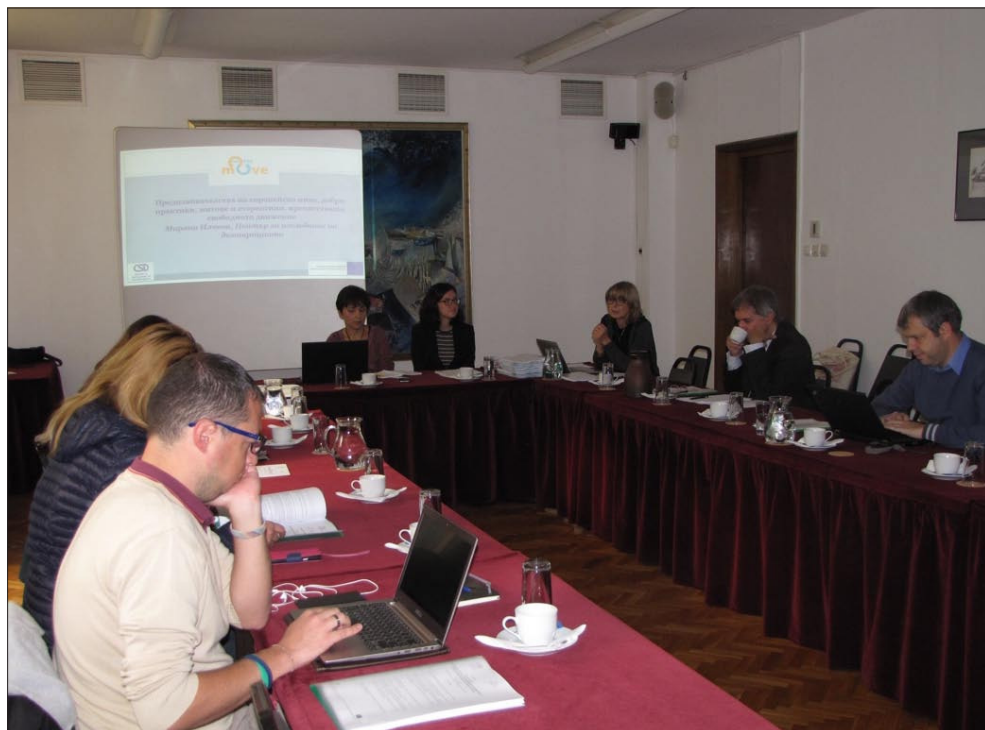
Правната програма представя движещите фактори и пречките за свободното движение на младите хора на национален семинар през октомври 2017 г.

следване на демокрацията продължи да събира данни и информация по различни аспекти на спазването на основните права в България. Успоредно с приноса към изготвянето на Годишния доклад за основните права на Агенцията, през 2017 г. Правната програма анализира проблеми като проявите на омраза срещу мюсюлмани и мигранти; ромските и странстващите общности; женомразството (мизогиния), стереотипите по полов признак и речта на омразата, насочена срещу жени; пречките, които срещат гражданите на ЕС при упражняването на правата си в друга държава членка; и статуса и полето на действие на НПО в сферата на зачитането и подкрепата