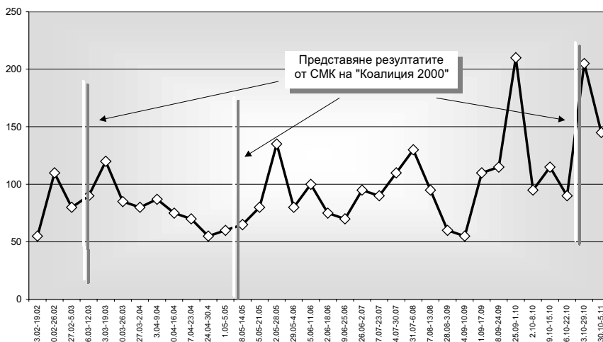
Брой регистрирани корупционни материали в пресата по седмици*

Инициативите на българските неправителствени организации имаха значителен мултипликационен ефект в международен план. Използвайки модела на Коалиция 2000 , подобни програми се разработват в Румъния, Македония, Босна и Херцеговина. В страни като Унгария и Турция също са заимствани разработените вече техники за мониторинг на корупционните практики.